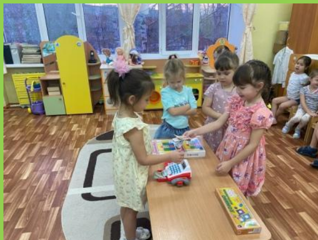
Сюжетно – ролевая игра «Магазин»