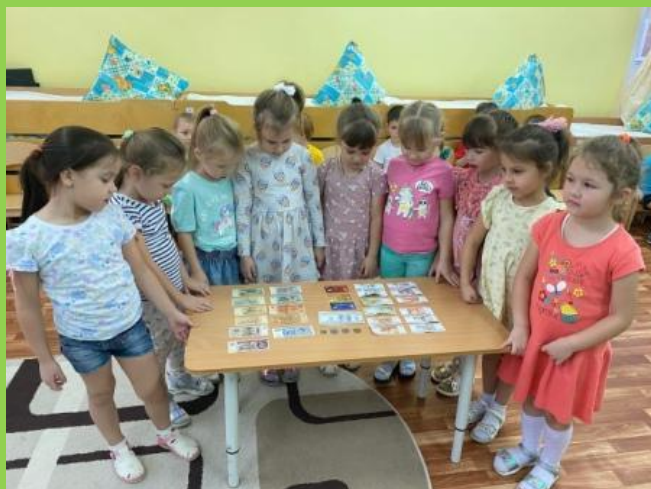
ООД «Что такое деньги и откуда они берутся?»